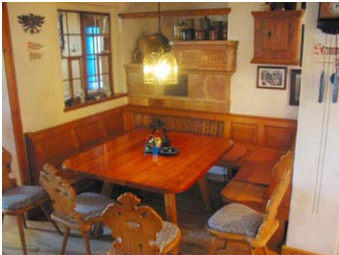
... die Gaststube

Ab Freitag wird dann der KLM München in der Fussgängerzone von Lindau einen KLM-Infostand betreiben sowie abends zum Infoabend mit Musik und Tanz einladen.