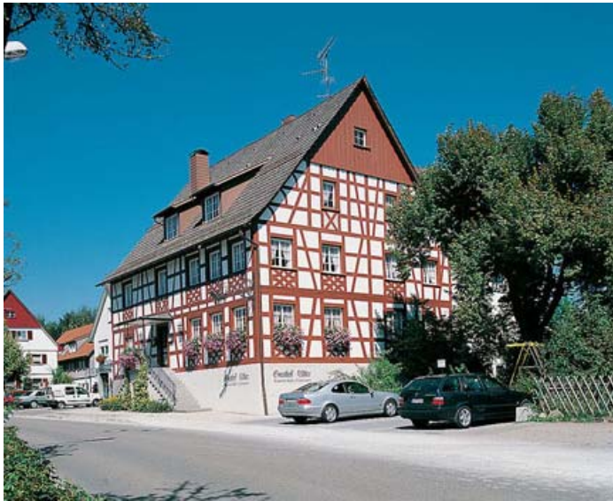
Gasthof Adler im Lindau-Oberreitnau ...