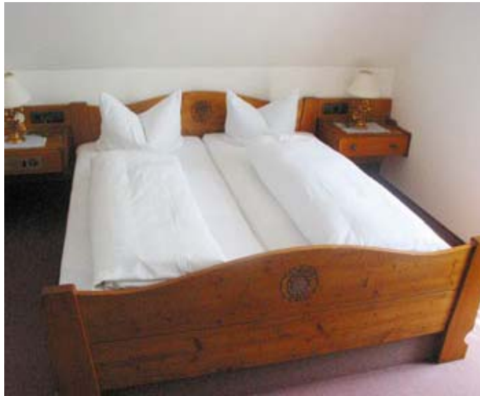
Es gibt auch Betten ohne Fussende

Die Wanderwoche 2005 führt uns an den Bodensee nach Lindau. (Luftkurort und internationale Tagungsstadt im Dreiländereck Deutschland - Österreich - Schweiz)